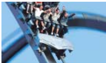
EUROPAPARK RUST: Bei den Schweizern am beliebtesten.

Die Fläche des grossen Parks ist in europäische Länder aufgeteilt. So findet man dort auch ein Schweizer Chalet und eine Bobbahn. Die grösste Attraktion ist die Achterbahn «Silver Star» mit gewaltigen Höhenunterschieden und hohem Tempo. Es ist die höchste und schnellste Bahn Europas.