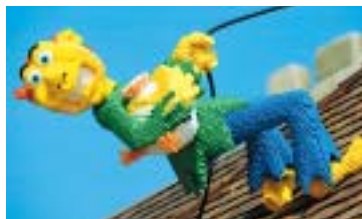
LEGOLAND GÜNZBURG: Mit viel Liebe zum Detail.

Dieser Park ist ganz auf Familien ausgerichtet. Deshalb ist er für «Adrenalinfreaks», die den Nervenkitzel lieben, weniger attraktiv. Die Testexperten rühmen das liebevolle Design und die stimmigen Attraktionen, die den kleinen Besuchern «aussergewöhnlichen Spass vermitteln».