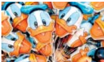
DISNEYLAND PARIS: Die Amerikaner setzen Massstäbe.

Gemeinsam mit dem Europapark Rust teilt sich dieser Park die höchste Punktzahl von 10. In keinem anderen Park findet man solch aufwändig in Szene gesetzte Attraktionen und Shows, so liebevolle Details oder fantasievolle Kulissen. Eine perfekt inszenierte «magische Welt».