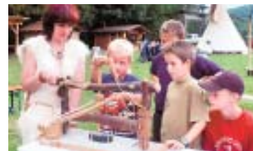
TRIPSDRILL STUTT GART: Mit erstaunlicher Professionalität.

Ein Park, der sich hauptsächlich auf die kleinen Besucher konzentriert. Dies «in einer bemerkenswerten Professionalität, die man einem so kleinen Park eigentlich nicht zutraut». Dies bedeutet aber nicht, dass sich Erwachsene langweilen müssen, auch für sie hats Attraktionen.